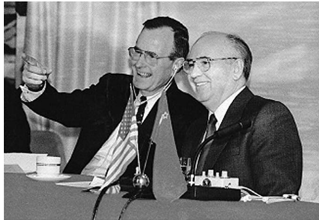
B 会談のブッシュとゴルバチョフ

この会談により、冷戦というアメリカ合衆国を中心とする C 諸国とソ連を中心とする社会主義諸国の対立の終結が宣言され、平和のための新しい国際秩序作りに両国が協力して取り組む時代が到来したことが強調された。ゴルバチョフの言葉には、その決意があらわれているといえよう。