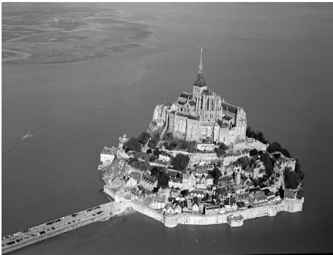
モン＝サン＝ミシェル

ローマ＝カトリック教会と同様にギリシア正教会 (b) でも修道院の造営が行われた。ギリシア北 方にあるメテオラには、ほぼ垂直にそびえるいくつもの柱状の岩山の上に修道院群が建立され ている。バルカン半島内の争いを避けた修道士らが14世紀中ごろから修道院の造営をはじめ たといわれる。14世紀末にこの地を支配したオスマン帝国 (c) は異教徒に保護を与え、修道院は 存続してフレスコ画の傑作も数多く残された。現在でも6つの修道院が活動を続けている。