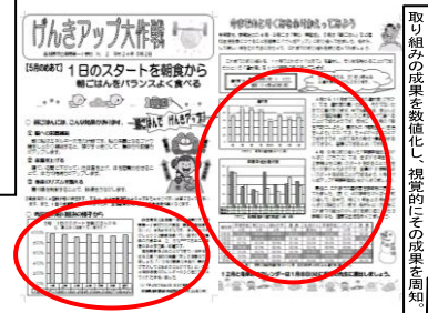
通信「げんきアップ大作戦」