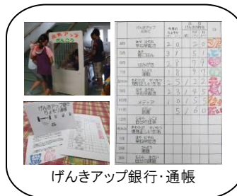
げんきアップ銀行・通帳