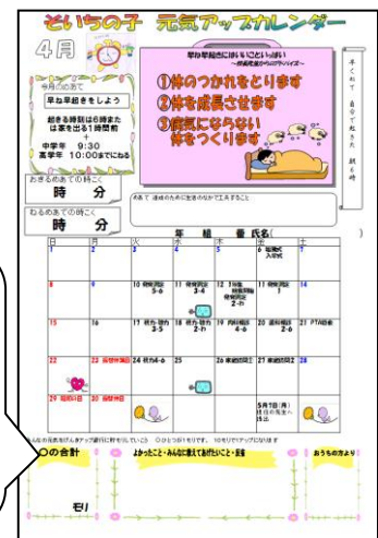
げんきアップカレンダー