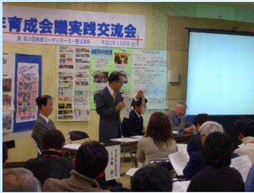
育成会議実践交流会