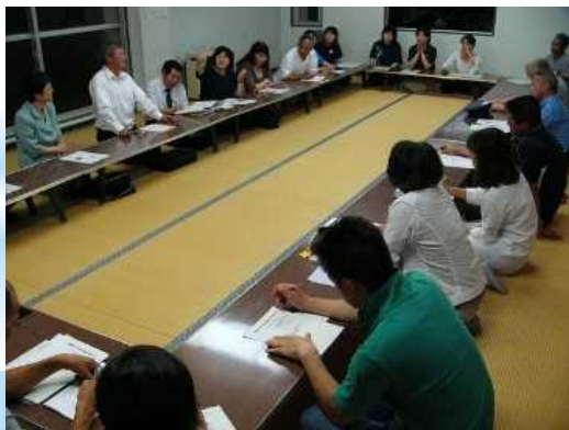
大島中学校区「大島っ子を語る会」