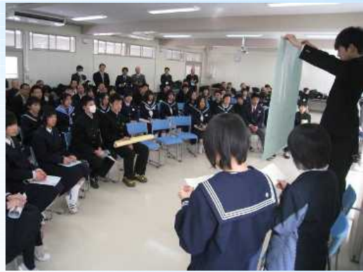
まちづくりに向けた中学生ワークショップ