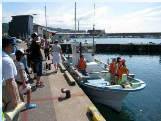
名立区「海の交流会で遊漁船体験乗船」