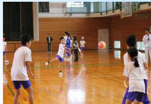
三和区「少年少女交流レクリエーション大会」