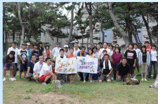
城東中学校区「ナイトウォークゴール記念」