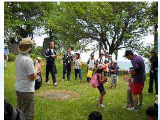
牧中学校区「牧っこ探検隊」