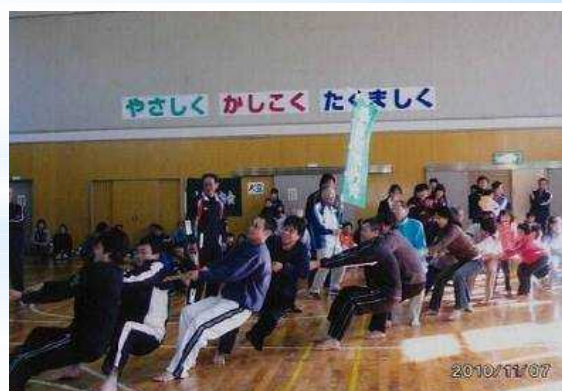
春日中学校区「地域・綱引き大会」