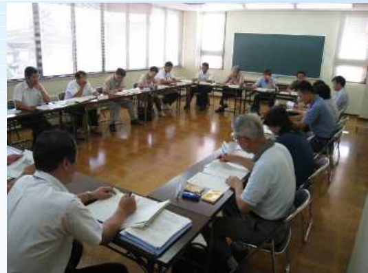
事務局担当者会議