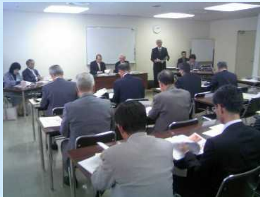
地域青少年育成会議協議会総会