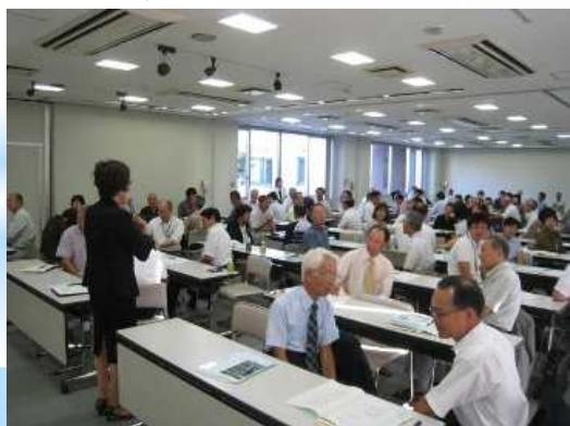
地域コーディネーター研修会