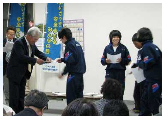
潮陵中学校区では、子ども委員を任命