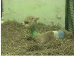
写真13. 鼓張症で入院中のラマ