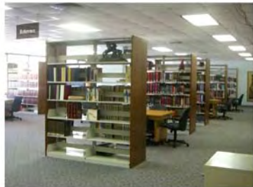
写真1. 図書館(教科書のみ所蔵) 獣医学部外にサイエンスライブラリ ーがある。