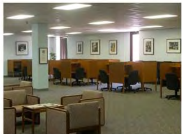
写真2. 図書館内 Study space