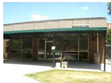
写真8. 地域診療科(小動物病院とは別に設置)小動物病院の面積が狭いため、2006年に皮膚科、行動科、地域医療科のみ本別棟に移動した。