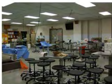
写真4. 解剖 実習室