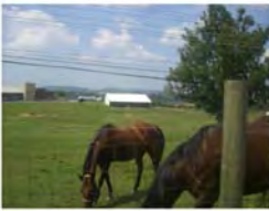
写真14. 大動物実験施設に隣接した馬の放牧場(実習馬20頭飼養)