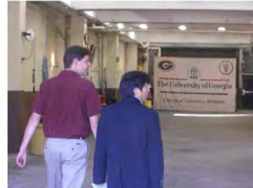
写真7. 大動物病院 動物搬入口右側に入院室、左側に麻酔準備室および手術室がある。