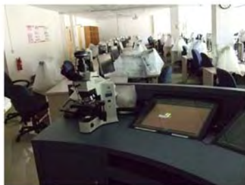
写真3. 顕微鏡 実習室