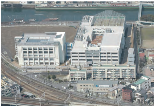
全体俯瞰写真。敷地を有効活用するため、体育館棟を重層化して屋上にプールを設置。