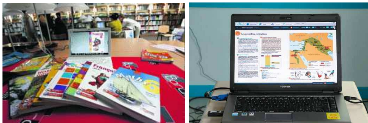
図表Ⅳ-9 フランスの電子教科書 (manuel numérique)