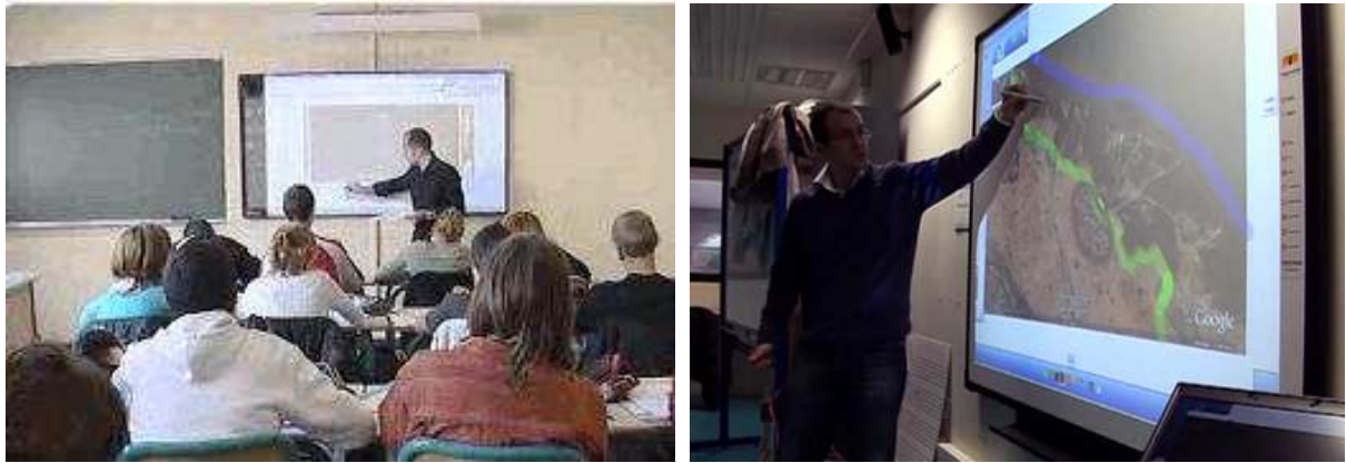
図表Ⅳ－10 インタラクティブ・ホワイトボード