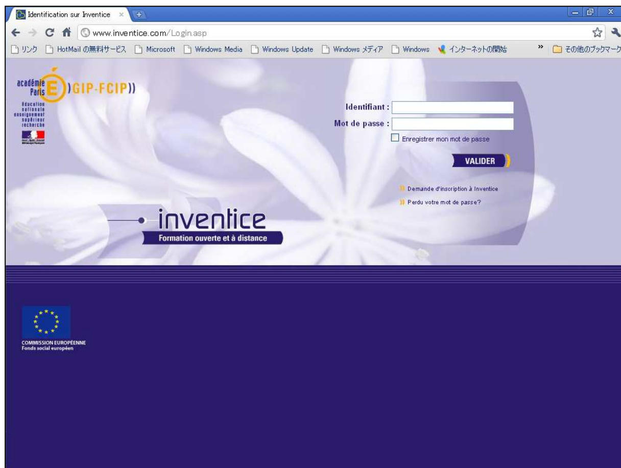
図表IV-5 Inventice のログイン画面

2005 年末時点で、オンラインコースでは、下記の 6 分野において、全 25 コースが開講されていた。2010-11 年の開講コース一覧では、「社会活動」「パラメディカル」「保健」等の分野でもオンラインコースが提供されている。