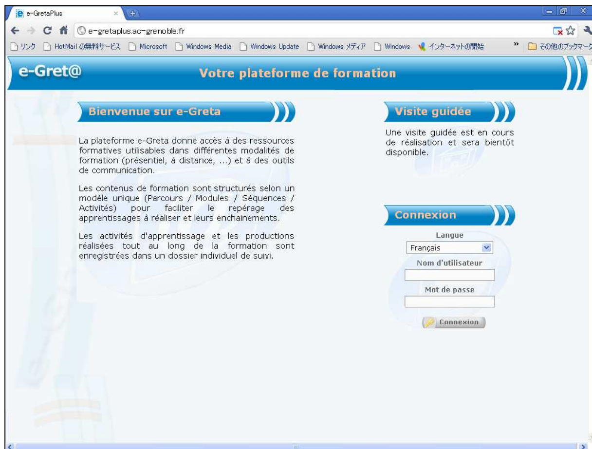
図表IV-4 e-Gret@のログイン画面

e-Gret@には、生徒用、教師用、コーディネイター用の3種のインターフェイスがある。