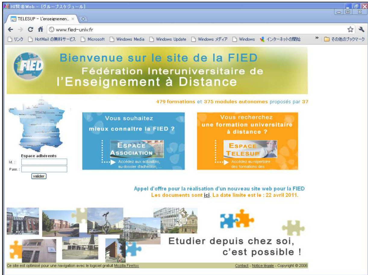
図表IV-8 Telesupのトップ画面