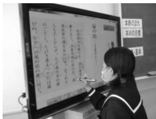
生徒が歴史的仮名遣いを電子ペンで囲む

漢字の練習の際に、書き順を動画で示す等すればより理解が深まると思われる。そのようなデジタルコンテンツを使用するか、自作教材として製作し活用したい。また、授業の中で時間を区切って活動に取り組みせる場面があるが、そのようなときに一体型電子黒板に大きくタイマーを表示することで、生徒は時間を確認しながら活動に取り組むものと思われる。授業の中のツールとしての活用を図っていきたい。