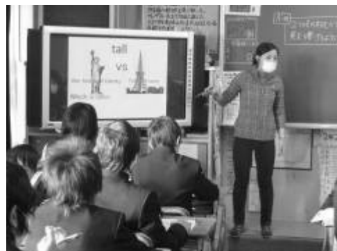
2つの絵を表示する

電子ペンを使った絵の提示や単語のフラッシュには適しているが、長文の提示には適しておらず、板書や模造紙と組合せて活用する必要がある。