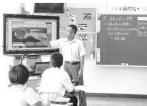
教員が地形の用語を提示し説明する場面

一体型電子黒板の反応が遅くなる場面があり、生徒の思考の進捗と整合しないことがある。また、一体型電子黒板と板書の効果的な使い方を研究する必要がある。