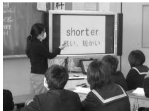
形容詞の語形変化の発音練習をする