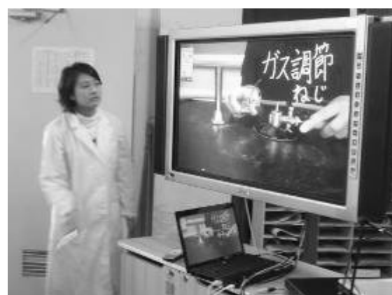
各部分の名称と役割を説明する