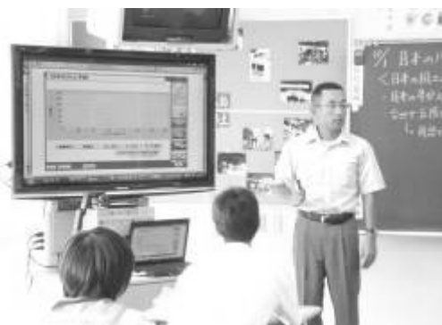
世界と日本の川の比較シミュレーション