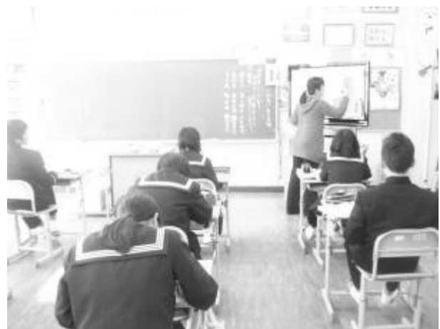
一体型電子黒板に古語の意味を書き込む様子