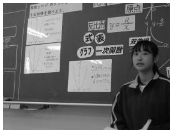
生徒が自分の考えを発表