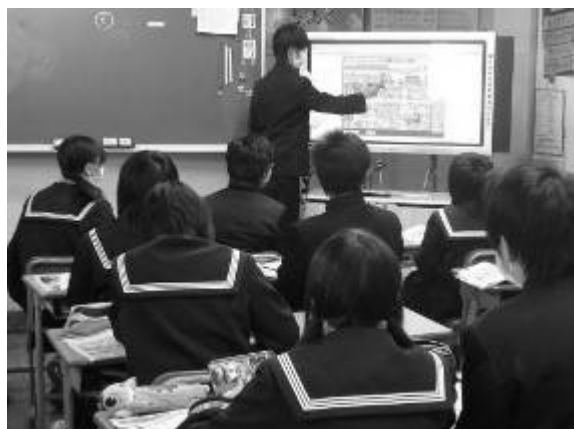
自分の考えを説明する