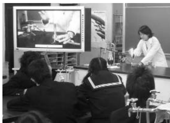
教員の手元を拡大する

一体型電子黒板の画面では正確な炎の色を示すことができないため、実物を示しながら、拡大提示する必要がある。