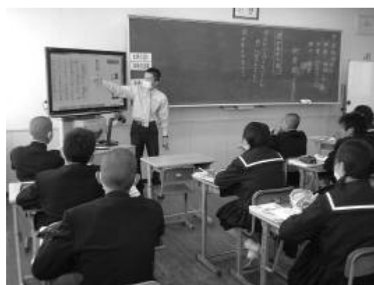
教員が歴史的仮名遣いの解説を加える