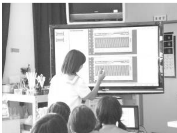
生徒が波形を比較し書き込みながら説明

また、課題解決や発表のツールとして十分に使いこなせるように、教員・生徒の操作の知識や技術の向上が必要である。