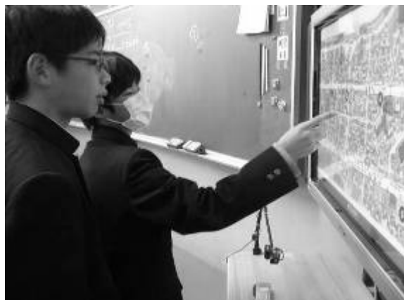
一体型電子黒板を使って班の生徒と話し合う

電子ペンを使って地図を拡大提示して書き込んだり文字を書いたりすることで、わかり易い説明ができ話し合いが活発になることがわかった。しかし、話し合いの結果を記録したり他の班と比較したりするためには黒板を有効に活用し、それぞれの長所を組み合わせることが大切であることがわかった。