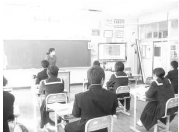
映像で理解する様子

教員がいろいろな機能を使いこなせるようになって、時と場合によって使い分けて教育効果を上げていくためにも学校で研修を通して取り組んでいく必要があると考える。