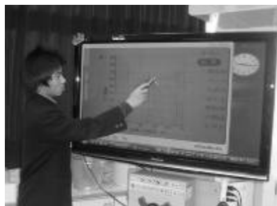
書き込みを加えながら説明する生徒

今後、地学分野の地層や地震といった学習内容が予定されている。スケールの大きな教材ゆえに、画像に書き込みながら説明したり、シミュレーションを見せたりといった一体型電子黒板を効果的に活用した授業展開を構築していきたい。