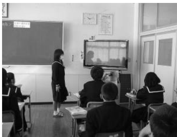
実物投影機を使用し、考えを発表する

更に、平面図形や空間図形等の単元では、イメージ形成の補助・補強の手立てとして、非常に有効であると感じている。