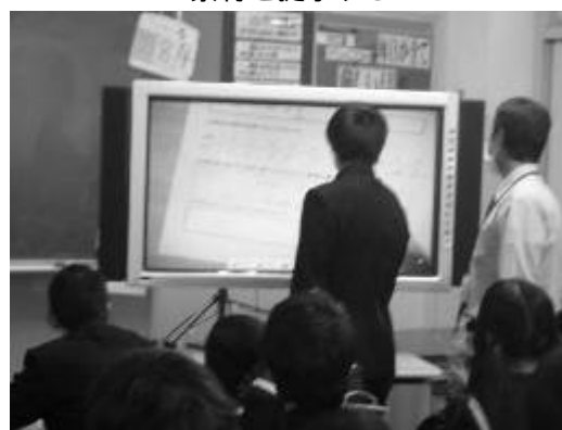
ノートを拡大提示して発表する