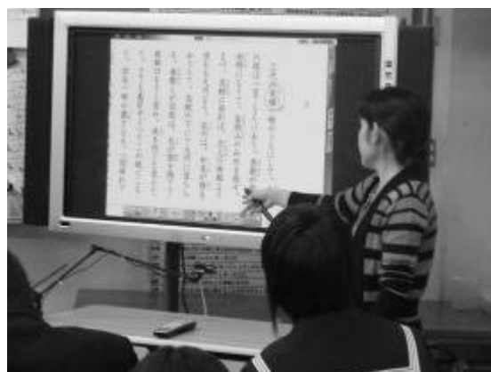
歴史的仮名遣いの部分を示す