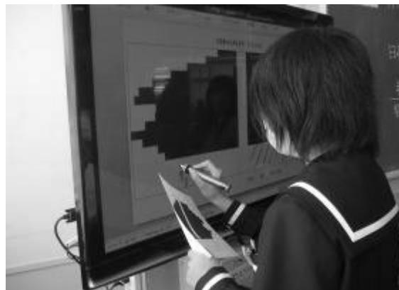
作成した人口ピラミッドを電子ペンで書き込む

今後は、世界と日本の資源と産業、地域間の結びつき等の授業が予定されている。地図やグラフ等を効果的に用いながら、授業展開を考えていきたい。