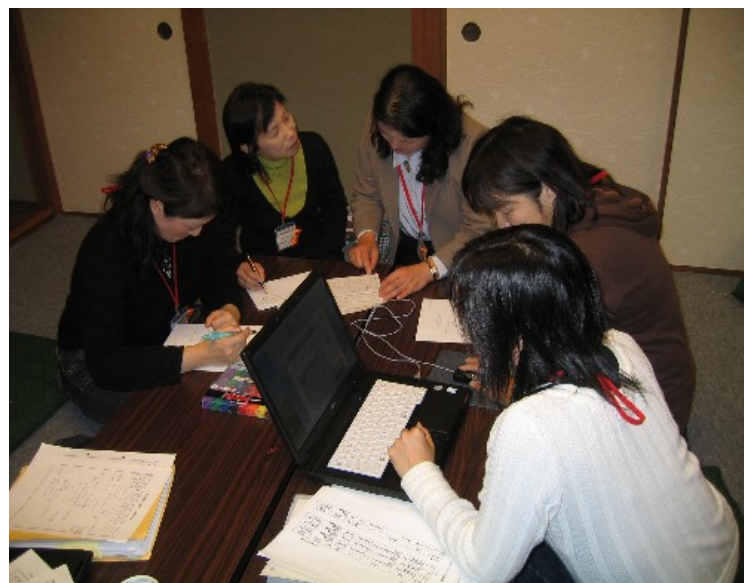
(チーム活動の様子)

などの地域で、身近な地域できめ細かな家庭教育支援を行うため、子育て情報誌の発行や子育て相談の実施、子育てサロン等へ出向いたPRや気軽な相談、家庭教育に関する学習機会の企画・運営などに取り組みられています。