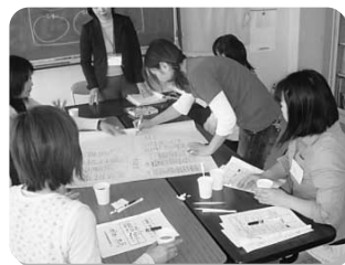
第2回子育てわくわくトーク、親子のコミュニケーションについて

⑥【その他の活動】 支援活動を推進する上で必要となる事柄(特別支援教育、相談活動の基本・ファシリテーター・KJ法等)について研修を進めるとともに、週に1度は情報の共有化を目的とする全体会を設けています。その他、支援員動静表、活動計画表、活動日誌、相談記録、個の支援記録などを作成しています。 3. 成果と課題 より一層の充実を図るため、保護者の立ち寄りやすい相談時間の配慮を考えていきます。また、今後の大きな課題は、家庭教育に関心がなく「困っていない」とする保護者に向けてのアプローチです。幸い本校は担当教諭との情報交換を密に行うことが出来、事業の趣旨が全校職員に理解されているため、学校側との協力態勢をさらに強化すること、対応策を講ずることが出来ると思われれます。