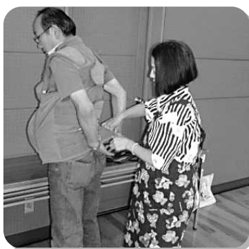
家庭教育支援の講座に参加されるお父さん

活動を通して、特に若いお母さん方の家庭教育支援チームの活動への関心が高く、毎回来しみに参加される方が増えてきました。一歩地域の中に足を踏み出すことで、親同士、子ども同士の交流も図られ、ほっと一息つける貴重な時間となっているようです。それと同時に支援チームの方々も地域の方たちと顔見知りになり、いろいろ相談を持ちかけられる機会が増えてきました。託児があれば参加したいという方もおり、より多くの方が身近な場所へ、安心して活動に参加できるよう環境づくり・体制づくりを図っていくことが今後の課題となっております。