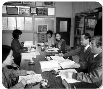
学校・子育てサポーターリーダー・サポーターとの情報交換会

等を訪問し支援しています。 ○福祉部局と協力し保護者に対して就学援助制度等の説明、支援を行います。 ○自作のパンフレットを作成し、子育ての方法等を保護者に伝えます。 ○不登校傾向のある児童宅に毎朝迎えに行き一緒に登校しています。 ○活動日誌、家庭別支援状況記録等を作成しています。 (3) 学習機会の提供 ○小学校参観日の学級懇談時に、子育てサポーターリーダーが「家庭教育のあり方」というテーマで講話を行いました。 3. 成果と課題 (1) 成果 ○リーフレットを配ったことが話題提起となり、戸別訪問がしやすくなりました。 ○子育てサポーターリーダーは学校内にいるため子ども様子がつかめ、担任と情報共有ができ、子育てサポーターは主任児童委員で地域からの情報が入り、家庭への細かな支援が行えます。 ○懇談会後に早速母親からの相談を受けるなど、まずは事業の趣旨やチームの活動を啓発することが第1だと感じました。 ○継続的な関わりの中で、不登校気味だっ