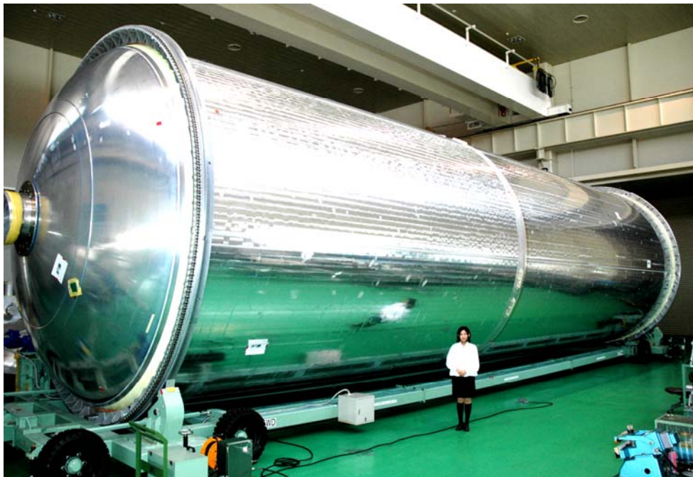
第一段水素タンク