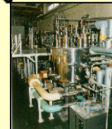
材料科学でリードする (東北大学 金属材料研究所)