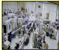
小型放射光で物質科学分野をリードする (広島大学 放射光科学研究センター)