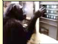
野生チンパンジーの生態学的研究を行う (京都大学 霊長類研究所) (愛知県犬山市)