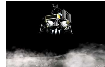
着陸技術イメージ