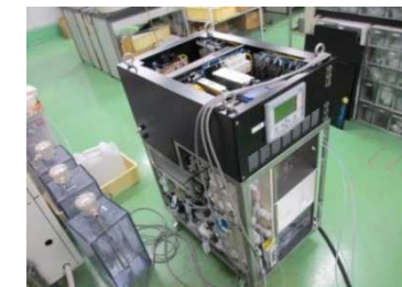
水再生処理システムイメージ