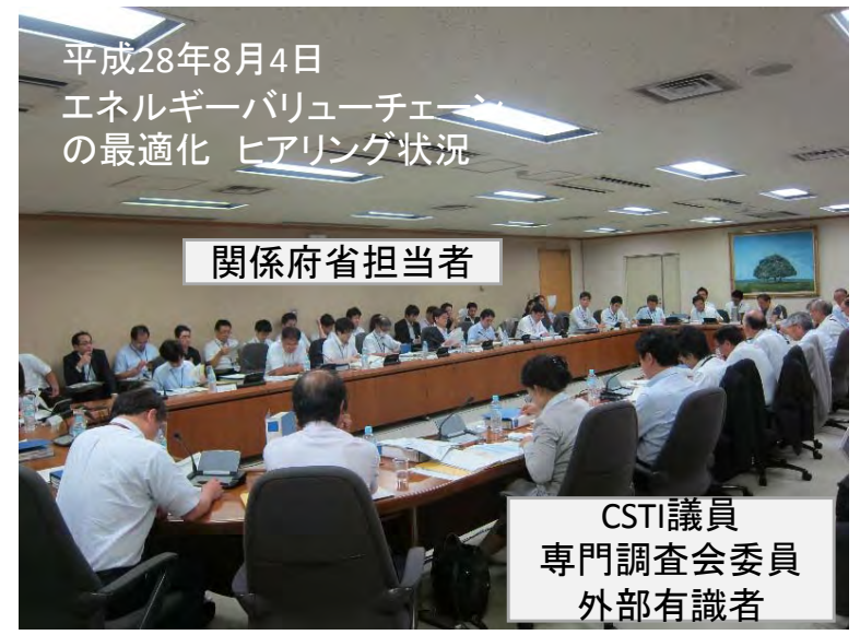
平成28年8月4日 エネルギーバリューチェーンの最適化 ヒアリング状況