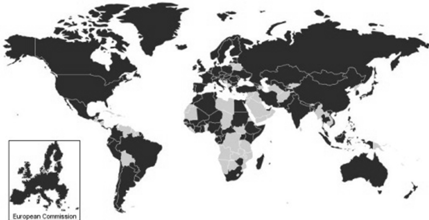
GEO Member Map for the year 2016