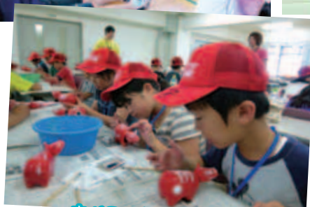
赤べこ、かわいく絵付けします。