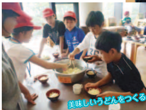
美味しいうどんをつくるぞ!