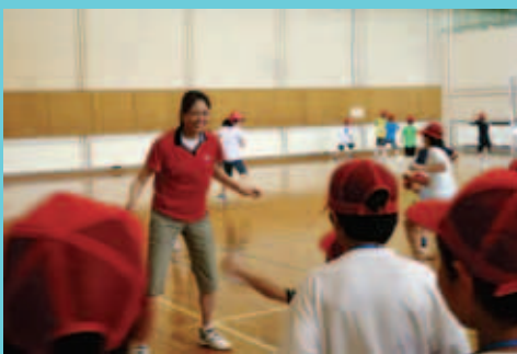
小椋 久美子氏 (バドミントン)