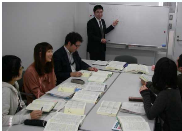
〔助教による指導の様子〕