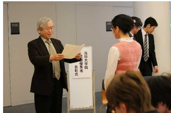
〔成績優秀者表彰式〕