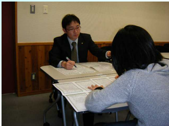
〔法律文書作成指導の一場面〕