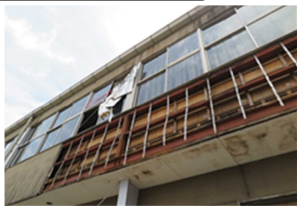
<経年劣化したラスモルタルによる外壁（湿式外壁）の落下（体育館）>