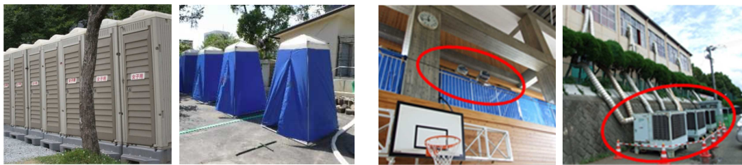
トイレ（左：仮設トイレ、右：マンホールトイレ） 汲取りの処理、照明、和式等の問題があり、マンホールトイレの設置を求める声があった。