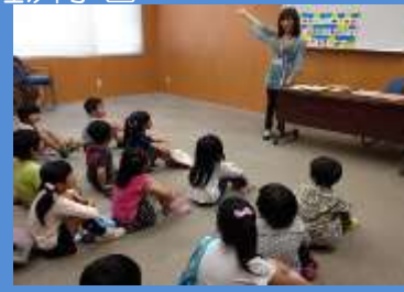
＜市民講師による英会話＞