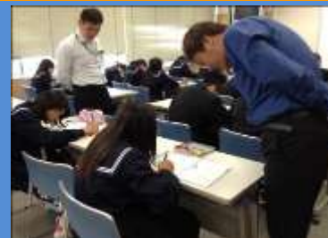
＜教員とのTTによる数学＞