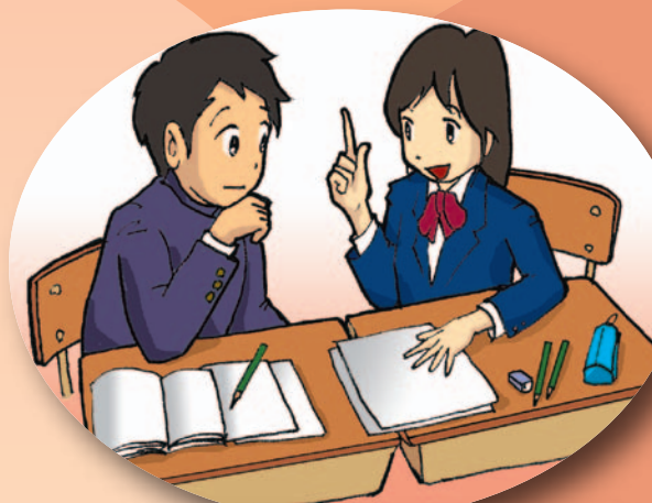
ペアで意見を交換する