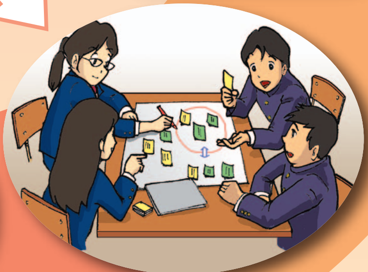
付箋を使って話し合う