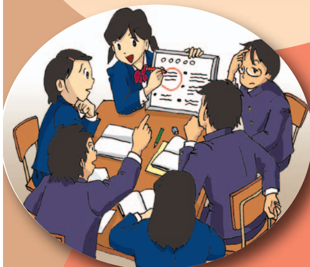
ホワイトボードを使って話し合う

生徒一人一人が自分の考えをもち、他者の考えとの共通点や相違点を意識しながら考えを深めていくような言語活動を充実しましょう。