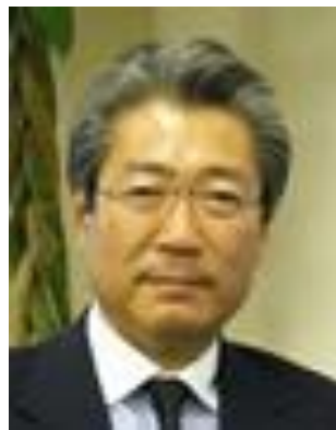
名誉会長 竹田恆和