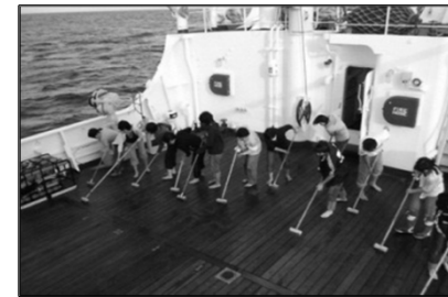
練習船「おしよる丸」の乗船訓練などを通し、チームワークやリーダーシップの育成を目指す。

全12学部の入学者の中から一定の英語能力を有し、希望する200人を対象に、特別プログラムとして「新渡戸カレッジ」を創設。このほか、一部授業の他大学への開放、海外オフィスの共同利用、研修の合同開催等の実施により、国内大学のグローバル化を牽引。