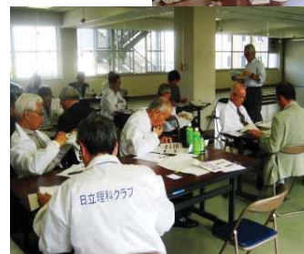
日本技術士会、学会シニアメンバーによる教材作成支援、対話型質問回答システム試作