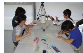
ロボットを使った対話型授業での発話効果についての実証実験 (異なるグループに同一の発話をするロボットを導入して効果を調査)