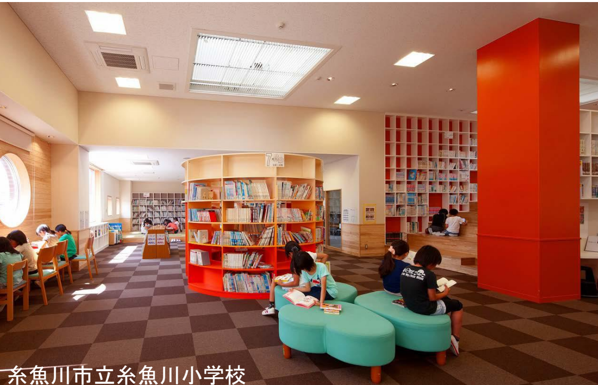
糸魚川市立糸魚川小学校