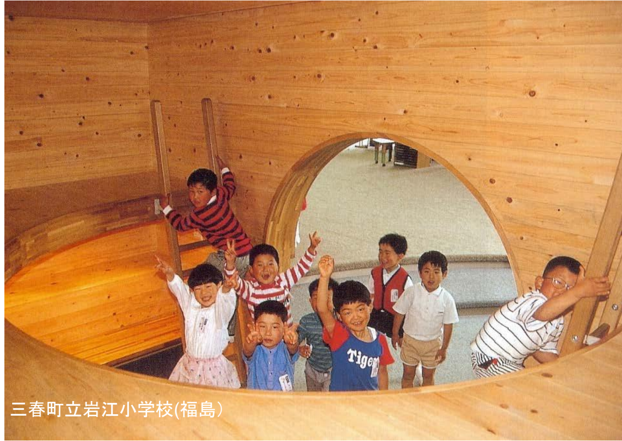
三春町立岩江小学校(福島)