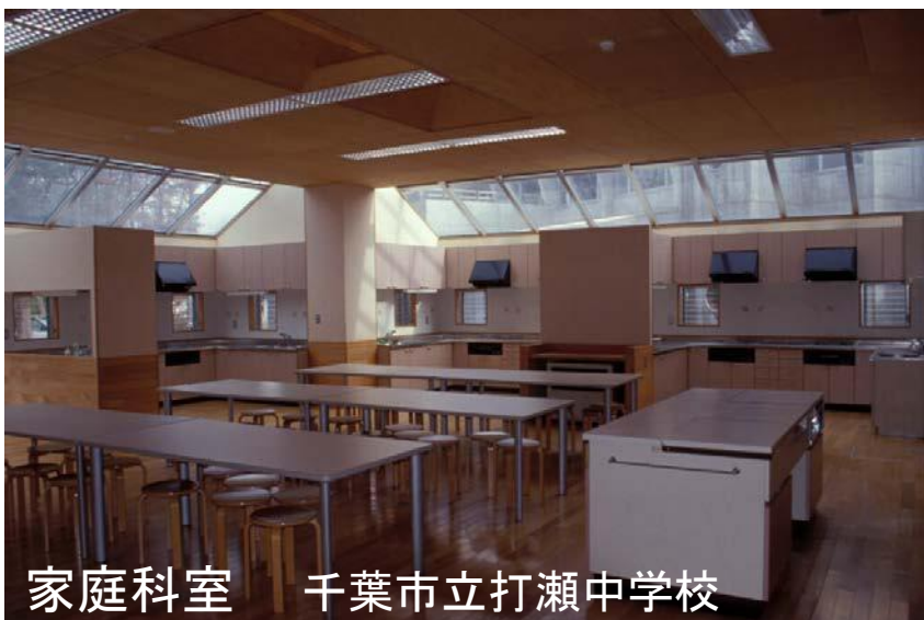
家庭科室 千葉市立打瀬中学校