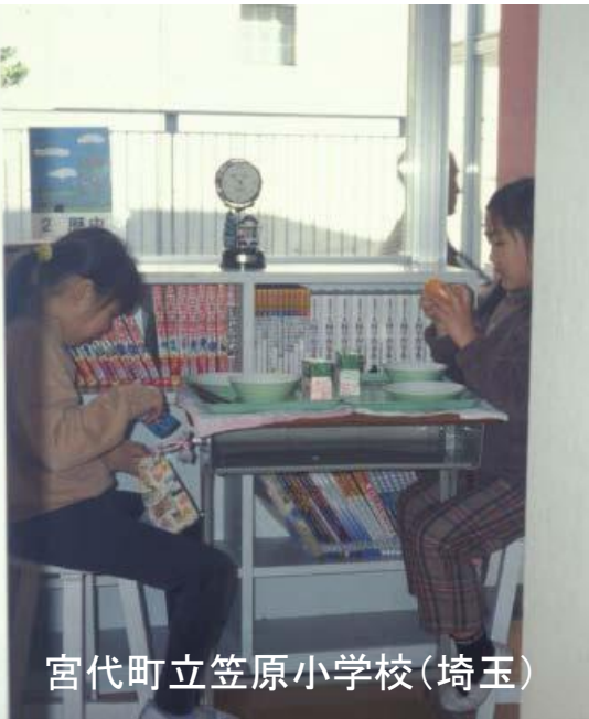
宮代町立笠原小学校(埼玉)