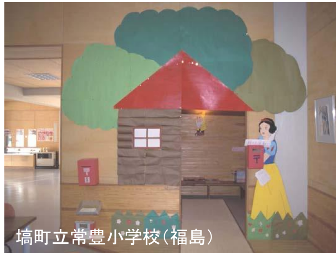
埴町立常豊小学校(福島)