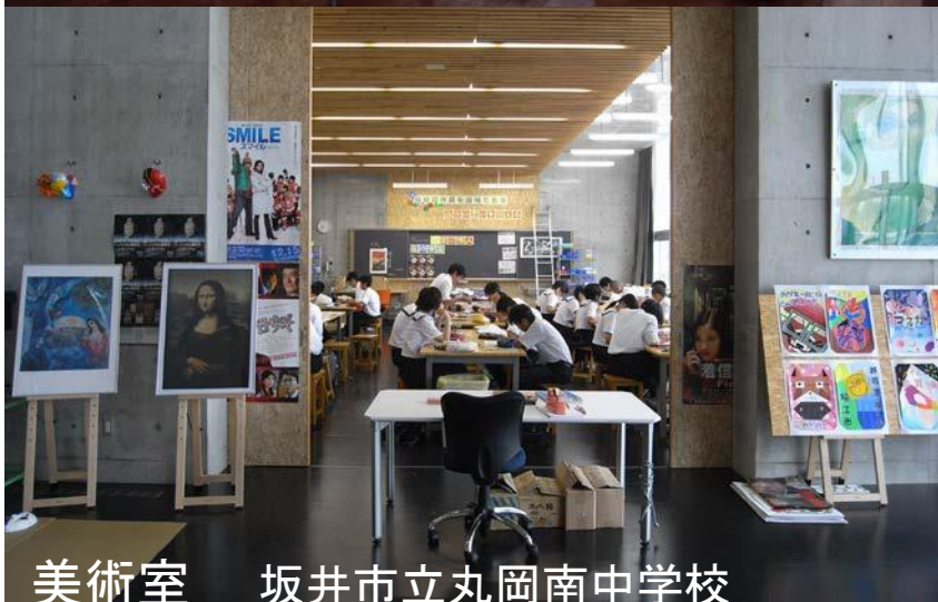
美術室 坂井市立丸岡南中学校