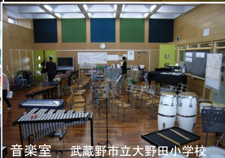
音楽室 武蔵野市立大野田小学校