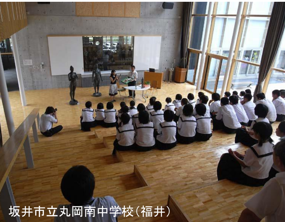
坂井市立丸岡南中学校(福井)