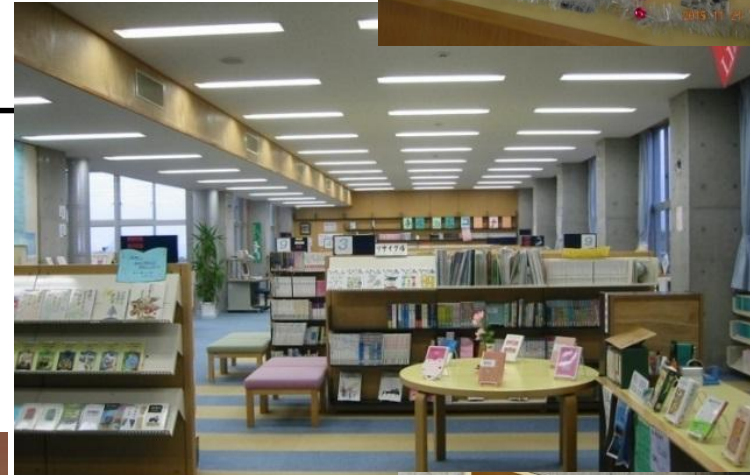
大洗町立南中学校(茨城)