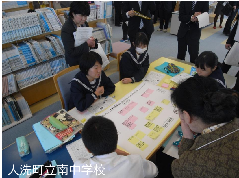
大洗町立南中学校