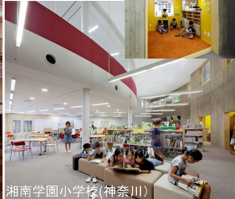
湘南学園小学校(神奈川)