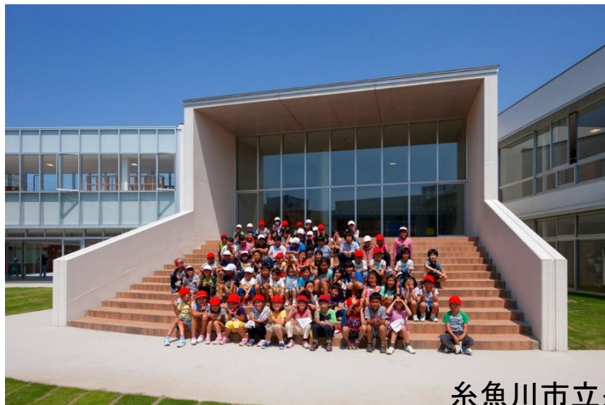
糸魚川市立糸魚川小学校