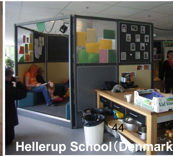
Hellerup School (Denmark)