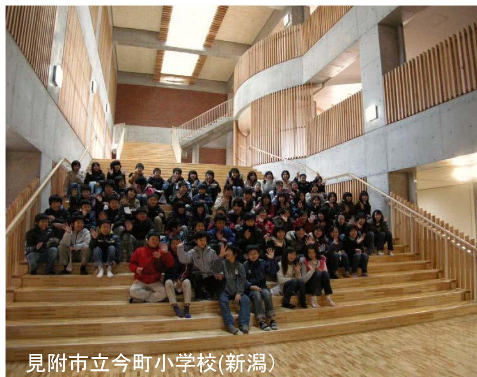
見附市立今町小学校(新潟)