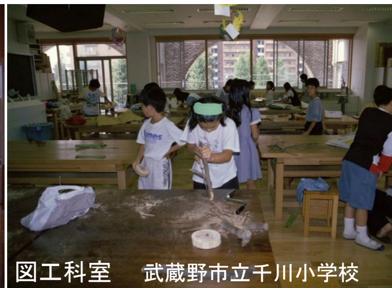
図工科室 武蔵野市立千川小学校