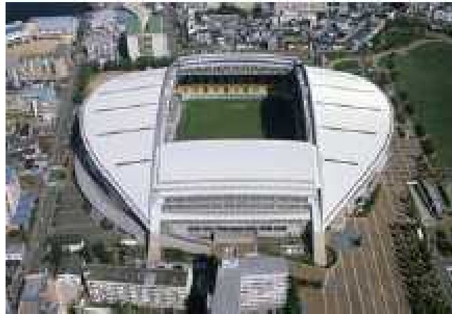
ノエビアスタジアム神戸