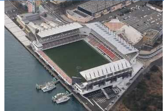
北九州スタジアム