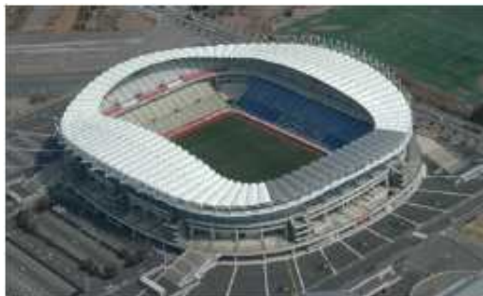
県立カシマサッカースタジアム