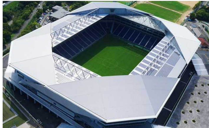
市立吹田サッカースタジアム