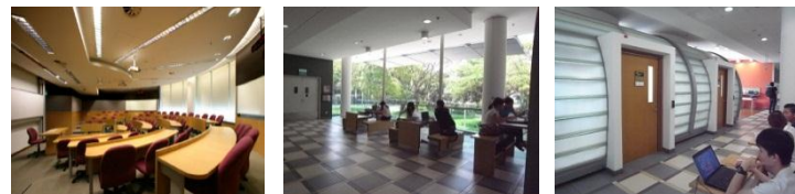
教室の周囲に自習スペースを整備