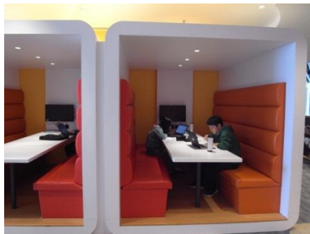
グループ学習スペース