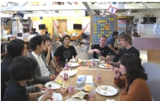
(スタンフォード大学プロジェクトルーム)