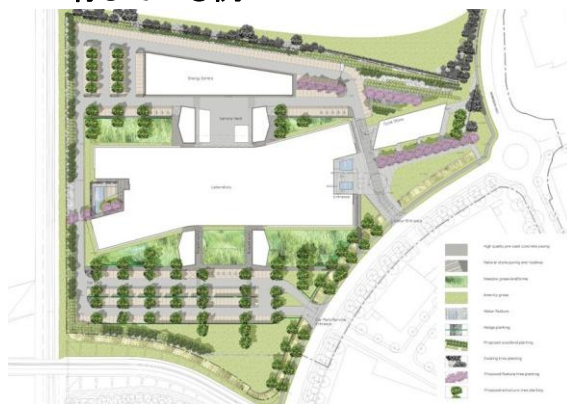
(英国王立分子生物学研究所)