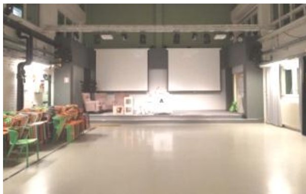
(アールト大学プレゼンテーションルーム)