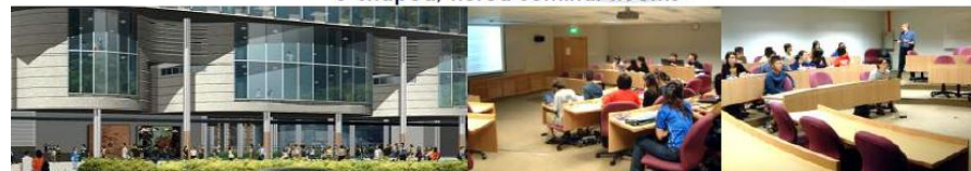
校舎外観 (1階は開放型の自習スペースとしても利用)