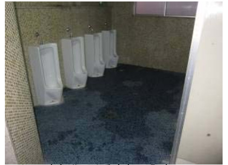
トイレの老朽化による臭気の発生