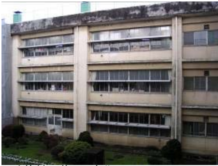
外装材の著しい劣化