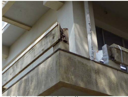
老朽化による手すりの落下