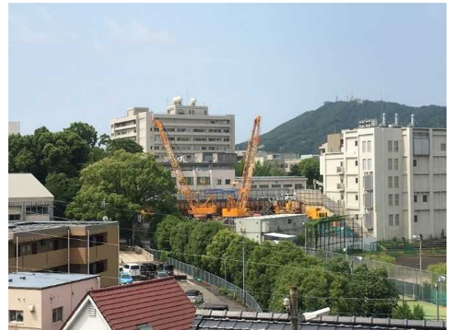
杭工事施工状況(全景)