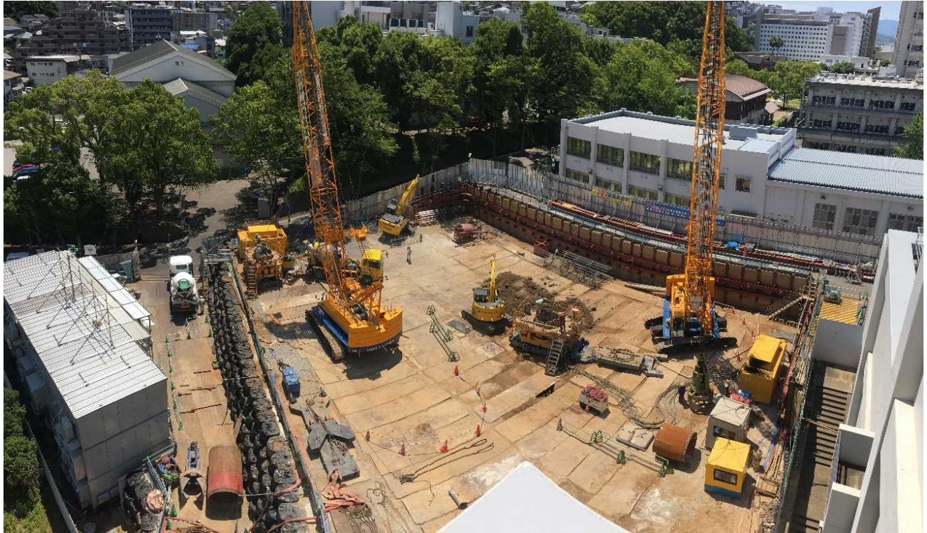
杭工事施工状況(全景)