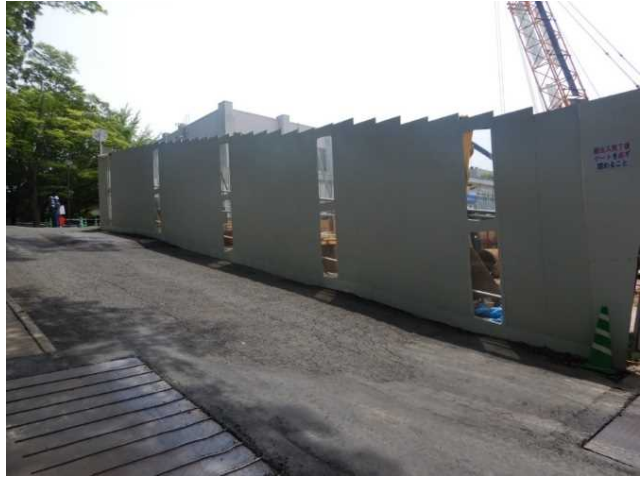
透明パネル設置 (東面仮囲い)