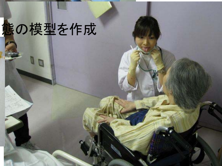
歯学部生は患者さんの歯の状態の模型を作成