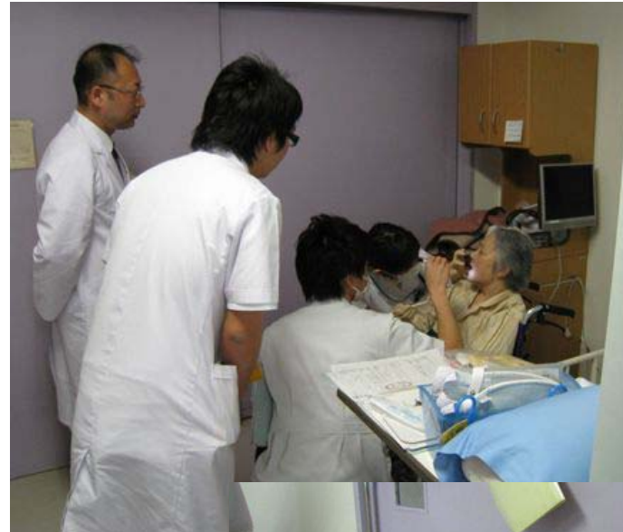
歯学部生は患者さんの歯の状態の模型を作成