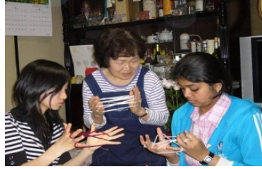
ホームステイ体験

政治、経済、農業、文化、教員、理工系研究者、ジャーナリスト等、各国の様々な分野での専門家を招聘して交流・意見交換を実施。様々な分野で問題意識を共有する東アジアにおける次世代のリーダーとなる人々のネットワークを構築。