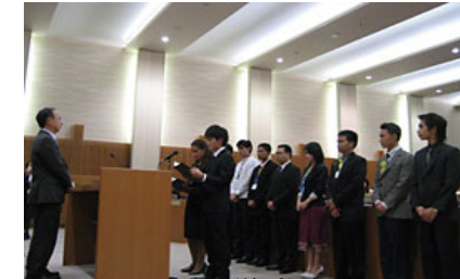
日ASEAN学生会議 共同声明の提出