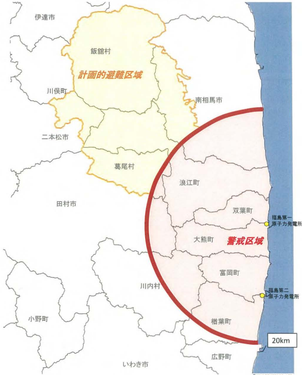
警戒区域と避難指示区域の概念図 (平成24年3月30日現在)