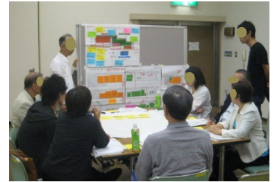
地域住民等との意見交換 (さいたま市)

各施設間の相互利用・共同利用に応じた専用部分や共同利用部分の管理区分や、光熱水費等の会計区分等の明確化や一元化の可否等について検討が必要。