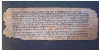
リグヴェーダ(古代インドの聖典)