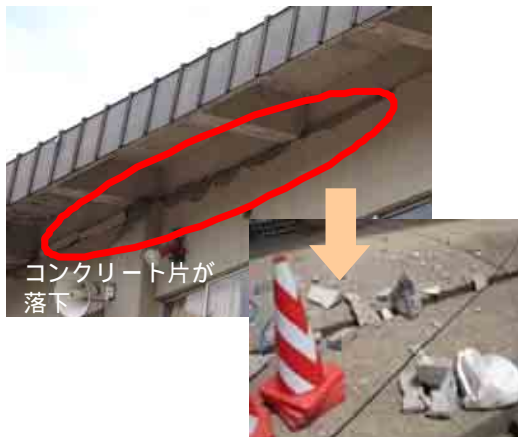
老朽化により コンクリート片が落下