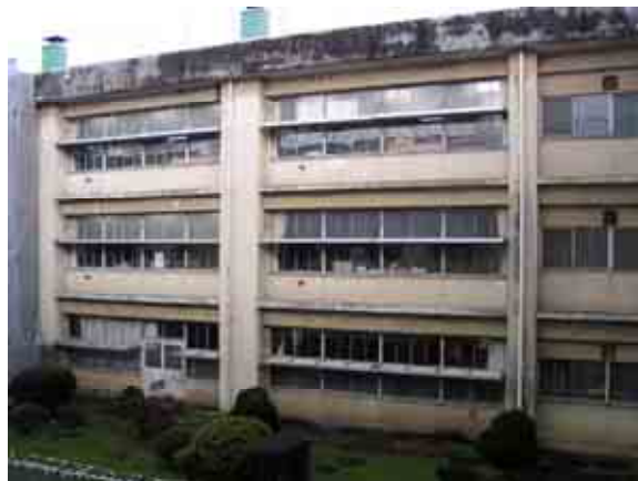
外装材の著しい劣化