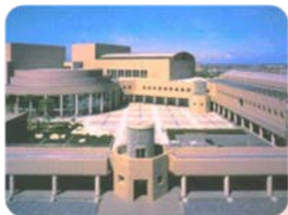
男女共同参画センター フレンテみえ