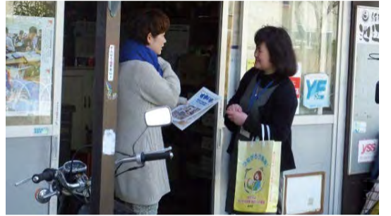
家庭訪問による子育て情報紙の配布

地域とうまくつながれず、不安や課題を抱えている保護者に対しては、家庭訪問等により個別の相談にのったり、学びの場や地域への参加を促す取組を行っています。