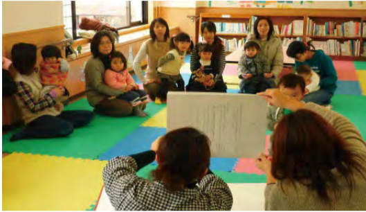
子育てサロンでの紙芝居

企業やNPO・地域ボランティアなど地域の力を借りて、親子で参加出来る様々なイベントや体験活動などを行い、地域とのつながりの中で家庭教育ができる環境づくりを行っています。