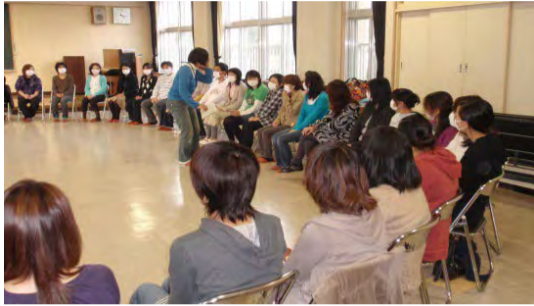
入学前の保護者向け講座

子育て・家庭教育の情報や知識を届けるだけでなく、他の保護者との出会い・交流の中で、自ら「学び、育つ」ための機会の提供を行っています。