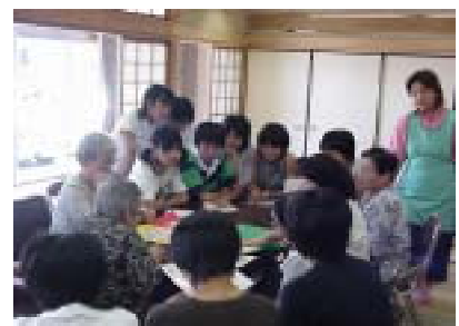
高齢者との交流活動