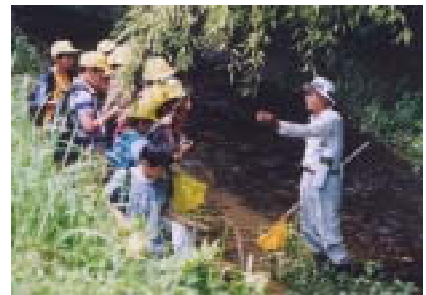
地域の人と源流探検