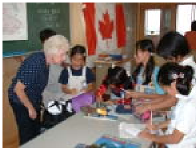
地域に住む外国人との交流活動