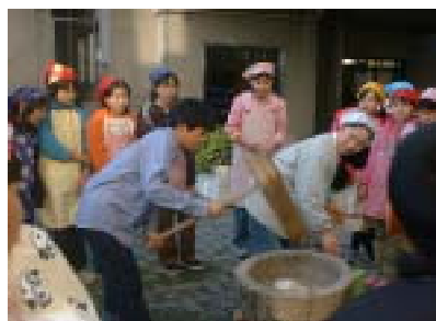
周りの人とかがわりをもった米の活用