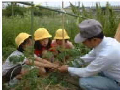
専門家との栽培活動