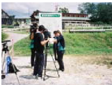
地域での職場体験活動