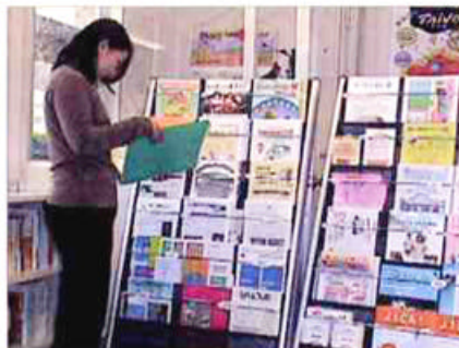
活動のヒントになる全国の事例を資料などから探すことができます。