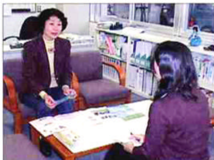
体験ボランティア活動の展開などについて相談窓口があります。

専門的な分野のお問い合わせに対応するため、アドバイザーがいます。コーディネーターのサポートをしています。