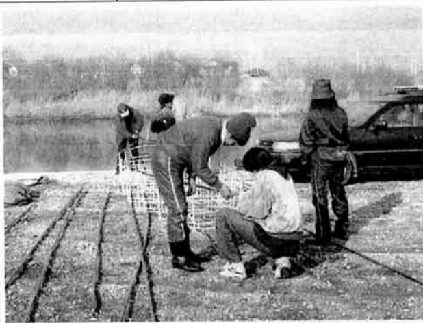
12月15日 Eボート操船訓練(組み立てから)