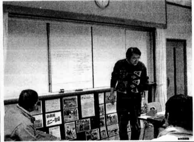
12月15日 プログラムづくり