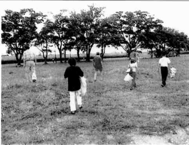
7月6日 ごみ拾い（散乱ごみ組成調査）