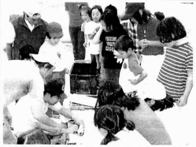
6月30日 川魚の料理法