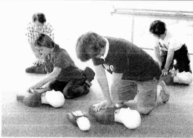
7月6日 心肺蘇生法訓練