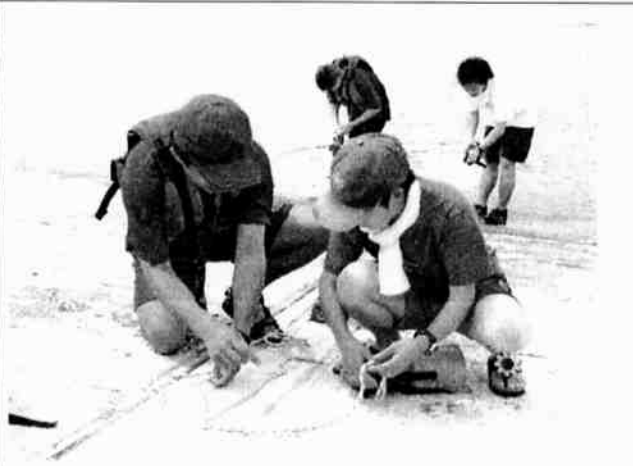
7月6日 ロープワーク