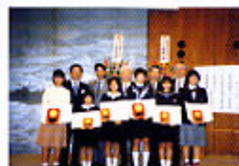
受賞者記念撮影風景

書物との出会いにより、感動することの素晴らしさを体験させることによって豊かな感性の育成を図り、感動を文章で表現することにより、読書力・文章力・創造力の向上を図ることを目的とし、財団法人出版文化産業振興財団の後援を得て、毎年読書作文コンクールを開催しています。