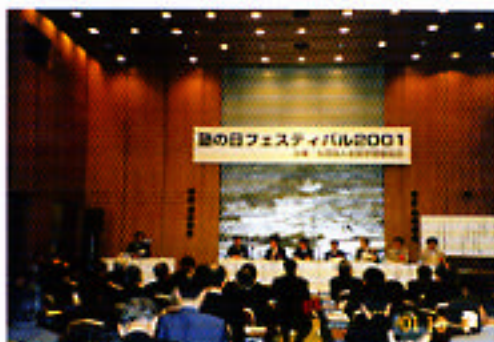
塾の日フェスティバル2001の一場面

学習塾が社会に正しく認識され、信頼されることをめざして、協会設立とともに「塾の日」を10月9日に制定しました。