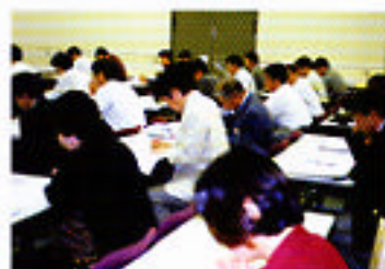
業界自主基準講習会風景

学習塾経営者・消費者を対象に、業界自主基準・特定商取引法・消費者契約法などの講習会やプライバシーマーク制度・サービス評価の普及推進・有効活用のためのセミナー等を開催します