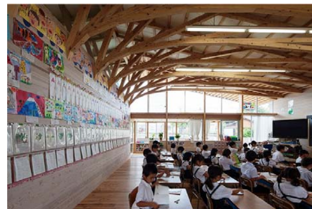
内装木質化の例 熊本県山鹿市立山鹿小学校（平成25年竣工）