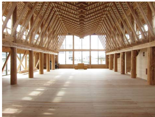
木造施設の例 福島県会津坂下町立坂下東幼稚園（平成25年竣工）