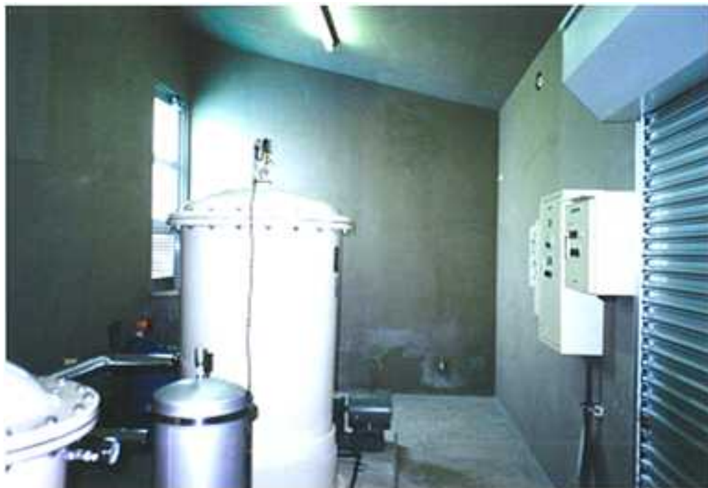
プールの水を飲料水や生活用水として利用できる緊急用給水システム

地震防災緊急事業五箇年計画の事業に計画されていたプールの整備にあわせ、 緊急用給水システム を整備した。