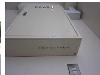
電源の自動切替え機能を持ち、下部から電源の取り出しができる電源切替盤