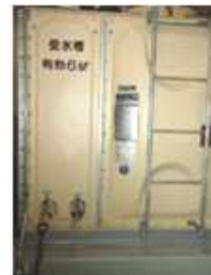
水を取り出せる水栓を備えた受水槽