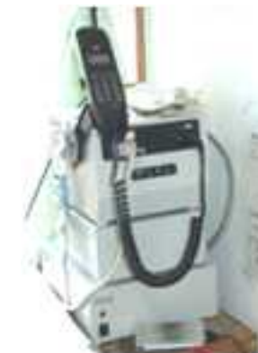
区の災害対策本部と連絡を行う防災無線