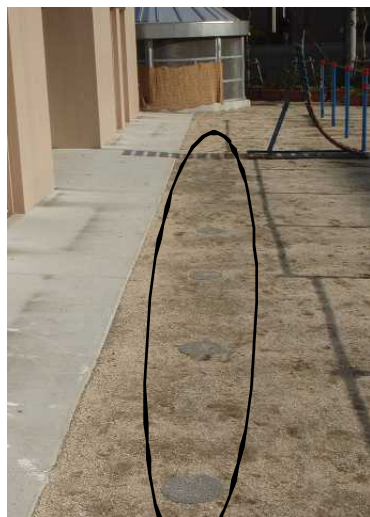
非常時にトイレとして使用できるマンホールトイレ