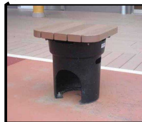
かまどベンチにより災害時の炊き出しが可能