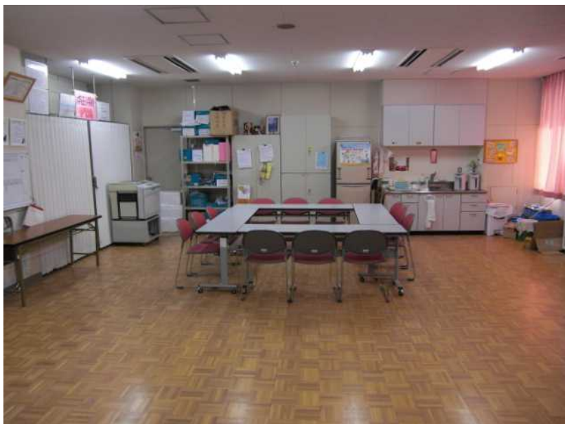
体育館の中に災害対策本部として活用できるミーティングルームを整備

阪神・淡路大震災の被災体験に基づき、改築した体育館の中に、災害時に防災対策本部として活用できるミーティングルーム、多目的トイレ、一般用トイレ、更衣室を整備した。