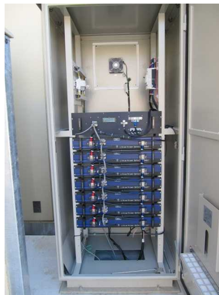
太陽光発電設備で発電した電力を受電できる蓄電池