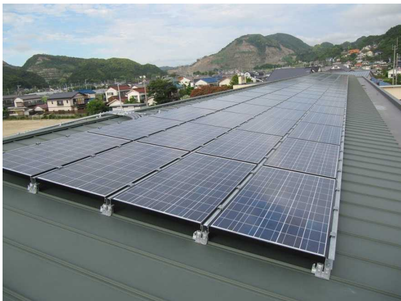
停電時でも発電できる自立運転機能を持った太陽光発電設備

災害時の使用が可能となるよう、校舎の改築に併せて、校舎の屋上に太陽光発電設備と蓄電池を整備した。