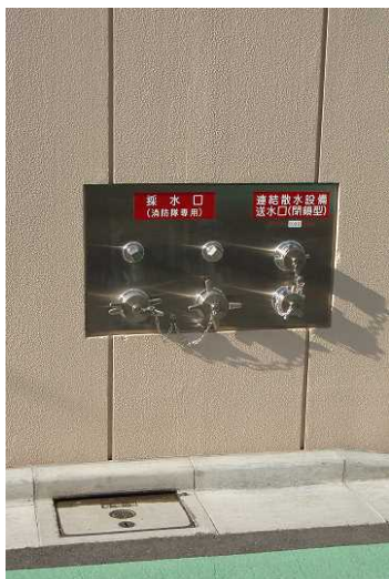
屋上プールの水を消火に使用できる消防用採水口

学校の改築に併せて、震度5強以上の地震が起きた場合の避難所(震災救援所)としての機能を強化するため、 プール水の消防用採水口、マンホールトイレ、防災倉庫、特設公衆電話、水栓付き受水槽、防災無線 を整備した。