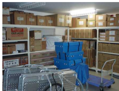
食料や発電機、毛布などを備えた防災倉庫