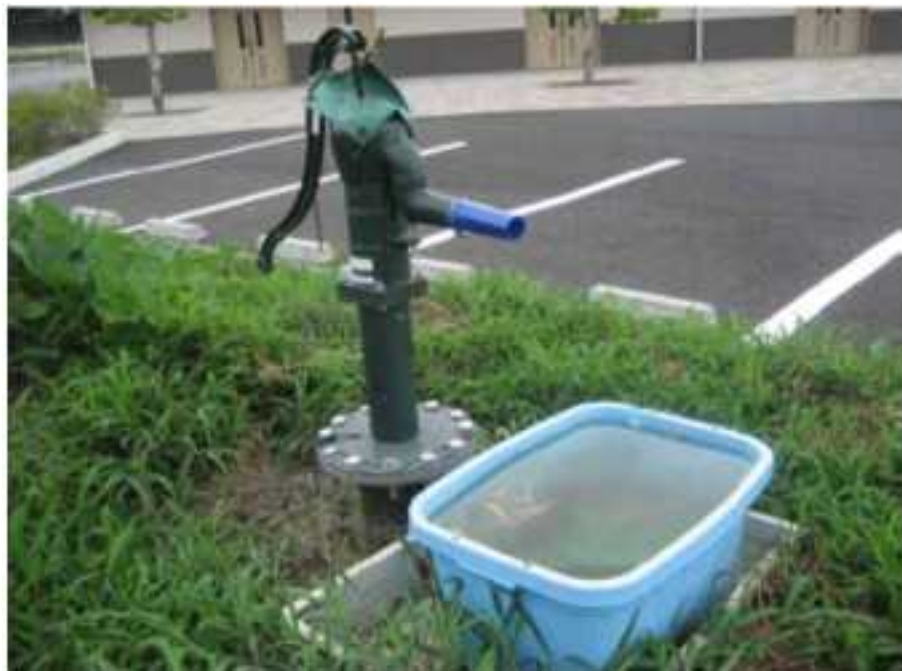
非常時の生活用水が確保できる防災井戸

新設小学校のコンセプトの一つとして「地域に開かれた学校づくり」を掲げ、 防災井戸、かまどベンチ、防災倉庫 などを整備した。