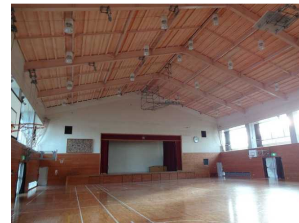
天井撤去工事後の体育館内部