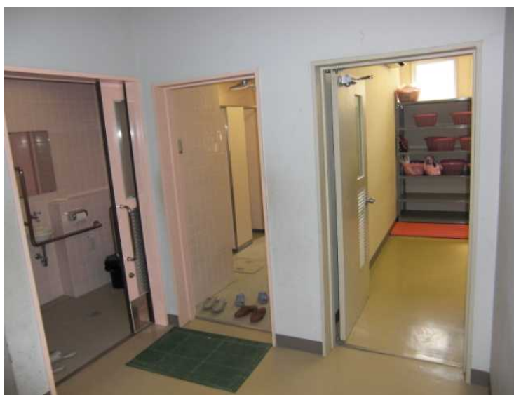
避難時に使用できるように、体育館に多目的トイレ、一般用トイレ、更衣室を整備