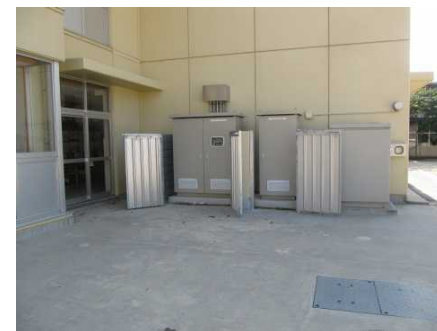
パワーコンディショナーと蓄電池盤