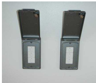
一般の電話回線が混雑しても優先的に使用できる特設公衆電話用ジャック