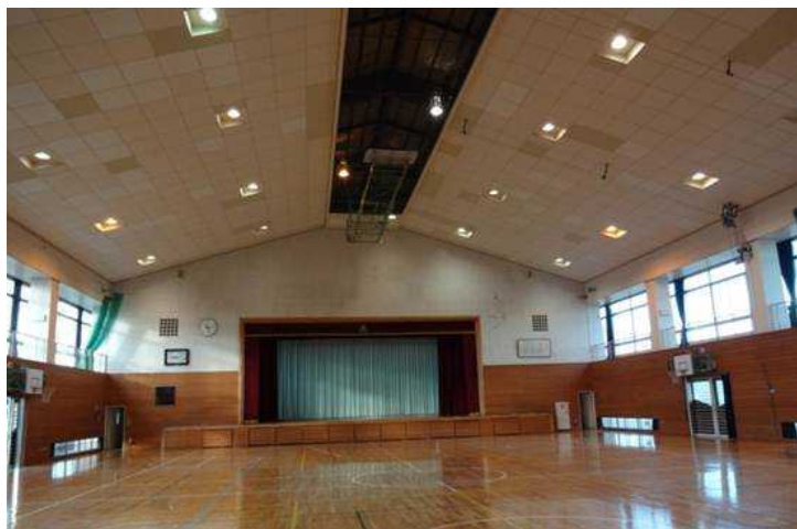
吊り天井を有する体育館内部