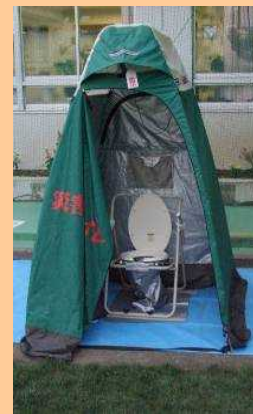
マンホールトイレ