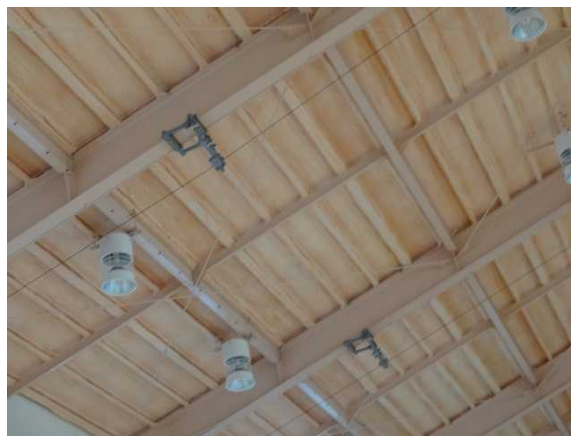
屋根面にウレタン材を塗布(鉄骨もウレタンと同色に塗装)