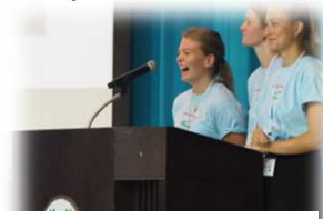
【世界高校生水会議2018年7月】