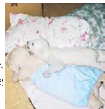
生まれてから 一か月。

人間が シロクマを そだてるのは、おずかしいと 考えられて いましたが、しいくいんの 人たちが 一生けんめいに 世話を した おかげで、ピースは 大きく そだちました。