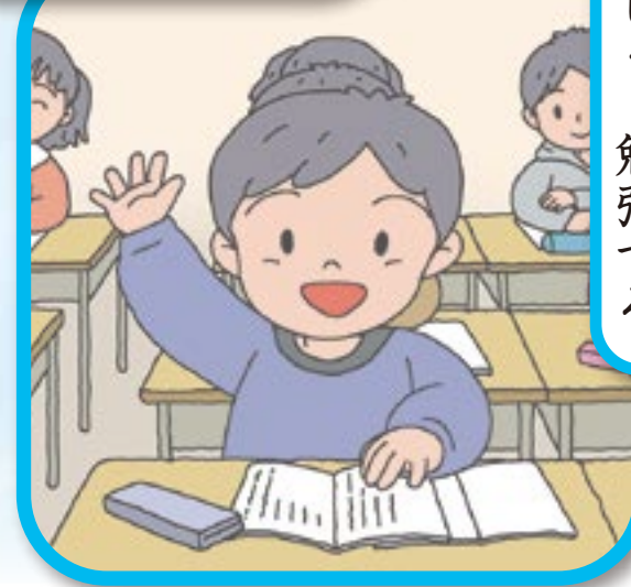
楽 し く 勉 強 す る

ど の よう な と き に、「生 きて いる」こ と を かん じ ます か。