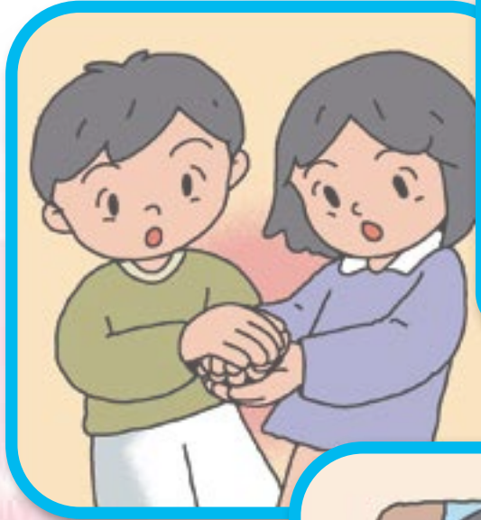
手 が あ た た か い

ほかに どのよう な とき に、 生 きて いる こと を かん じ ます か。 みん な で 話 し 合 い ま し ょ う。