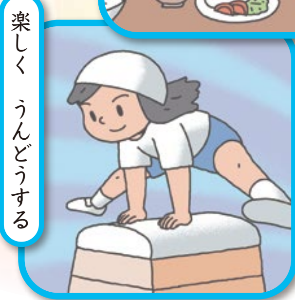
楽 し く う ん ど う す る