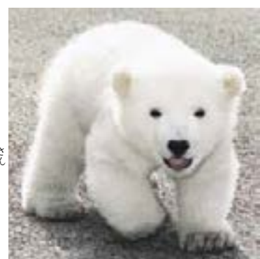
生まれてから 三か月。

どうぶつには、人間と 同じ いのちが あります。 ペットとして かったら、さい後まで しっかり そだてて ください。いのちの あるかぎり、 そだてて いく ことが 大切です。