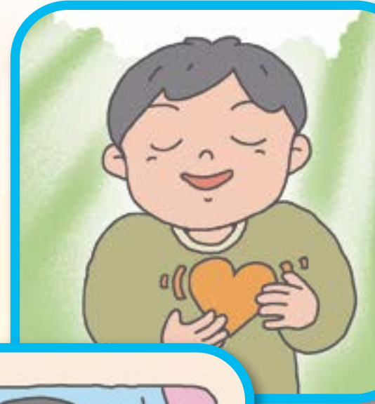
こ ゾ う が ど き ど き す る