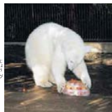
一さいの たん生日。 プレゼントは こおりの ケーキ。