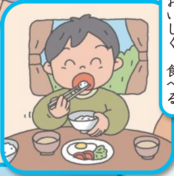
お い し く 食 べ る