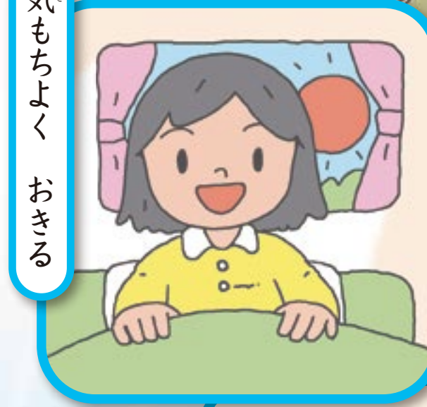
気 も ち よ く お き る