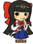
マスコットキャラクター 蓮花ちゃん