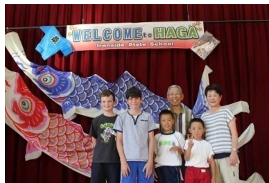
ホストファミリーとの マッチング