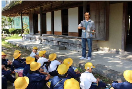
地域の先生による 「ふるさと学習」 ～古民家について学ぶ～