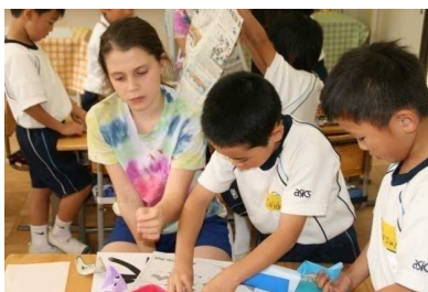
日豪文化交流授業