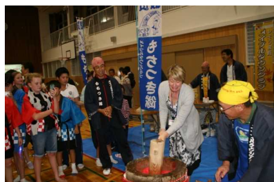
フェアウェル パーティー