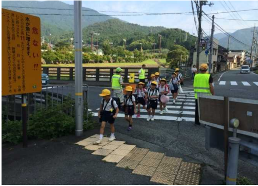
波賀っ子見守り隊の見守り活動