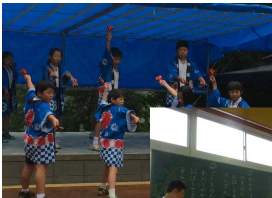
地域興しイベント