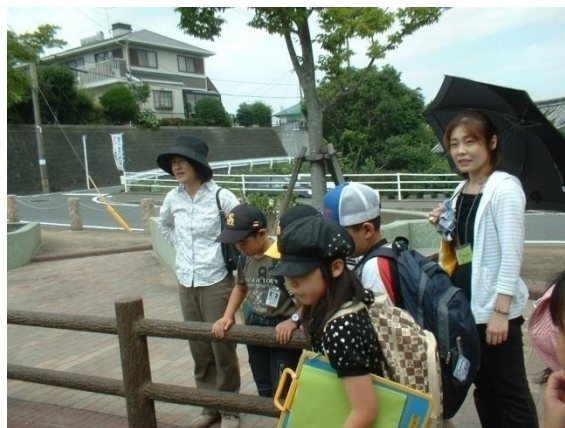
3年生；社会科・・・春日市たんけんでの引率