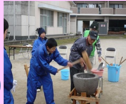
自治会の餅つき大会