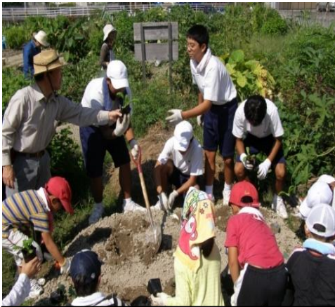
除草・収穫・田植え作業