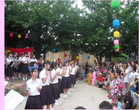
夏祭りでの吹奏楽出演