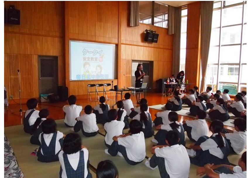
地域を知り、参加体制づくり