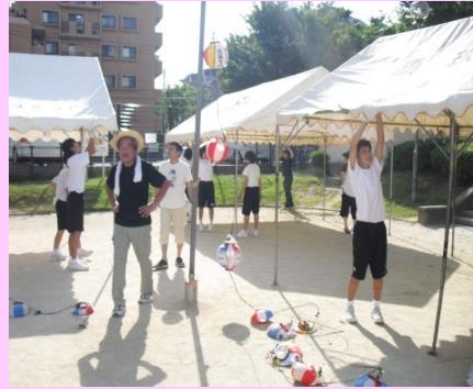
夏祭りの準備のテント張り