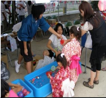
夏祭りの運営の手伝い