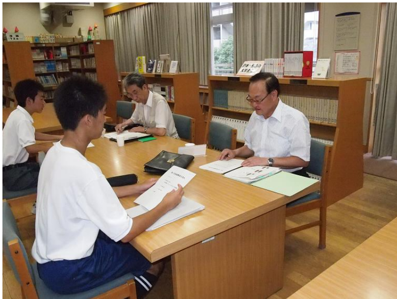
生徒代表と自治会長との打合せ