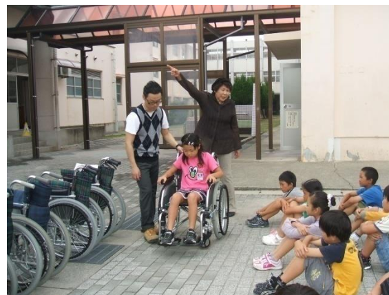
4年生；総合的な学習の時間 くるまいす体験