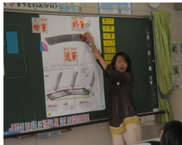
3年生；習字の学習・・・初めての習字で西っぴい先生からの指導