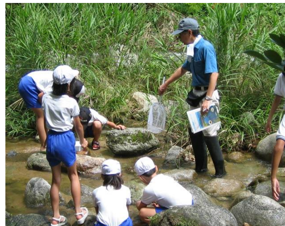
4年生；総合的な学習の時間 水辺の教室