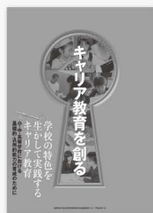
パンフレット 「学校の特色を活かして実践するキャリア教育」 平成23年11月

文部科学省及び国立教育政策研究所では、キャリア教育の実践の一層の促進のため、キャリア教育の趣旨の周知と指導内容の充実を図るパンフレットなどを作成しています。パンフレットなどは文部科学省HP上にも掲載していますので、御活用ください。