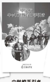
中学校手引き 平成23年3月