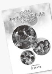
小学校手引き 平成23年5月