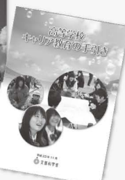
高等学校手引き 平成23年11月