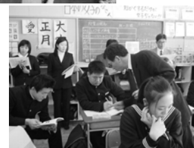
時中の見取りと個に応じた指導