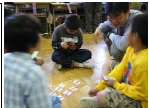
【パワフルゲームを行う子ども】

実施上の効果 ゲーム感覚でできるので、どの子どもも楽しく取り組むことができた。特に表記の違った小数を楽しみながら理解することができ、初めて小数を学んだ4年生の子どもたちにとっても有効であった。 また発展として取り入れたパワフルゲームでは、知らず知らずに小数の足し算の仕組みを理解することにつながり、その後の学習にも有効であった。