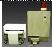
食品内異物検出装置

みそ、醤油、たれなど塩分濃度が高く、従来の金属検出装置では検出が困難であった食品内の金属異物をMI (マグネトインピーダンス) 磁気センサを用いて、高感度で検出する技術を開発し、アドバンスフードテック株式会社において製品化を行った。 知的財産・産学官連携推進本部 (現産学連携推進本部) は、MI センサの製造企業と交渉を行い、独自技術の保護を行うとともに事業展開が可能となる状況を整えた。